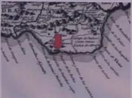
FOTO AÉREA 1946