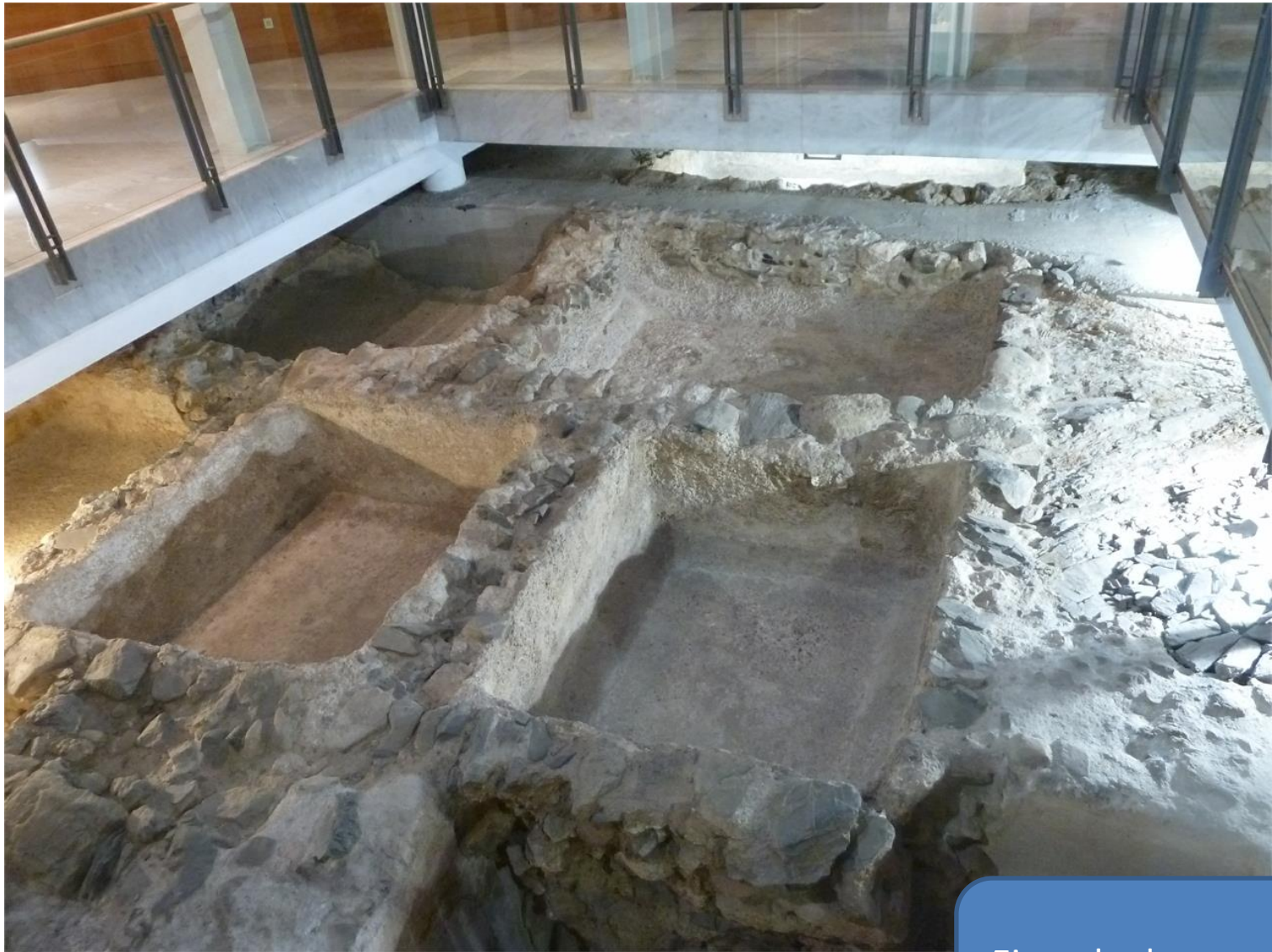
Ejemplo de unas piletas para salazones